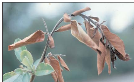
Feuerdornzweig ( Pyracantha ) mit Feuerbrand