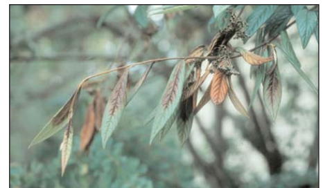
Cotoneaster salicifolius mit typischen Feuerbrand-Symptomen im Juli