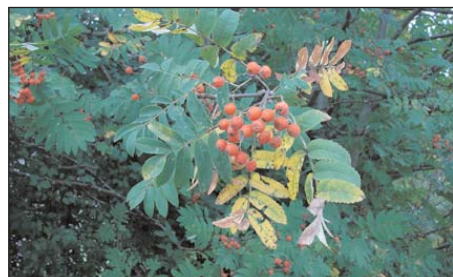
gesunde Vogelbeere ( Sorbus aucuparia ) mit Herbstverfärbung

Feuerbrandmeldestelle in Ihrer Wohngemeinde: