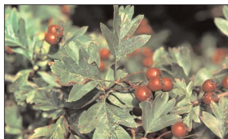
gesunder Weissdorn ( Crataegus )