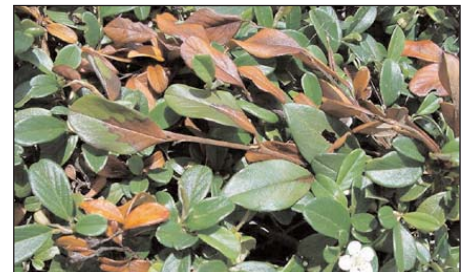
Cotoneaster dammeri mit Feuerbrandbefall zirka 2 bis 6 Wochen nach der Blüteninfektion (Juni)