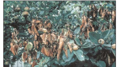
fortgeschrittener Feuerbrandbefall an Quitte

Feuerbrand ist eine meldepflichtige Krankheit!