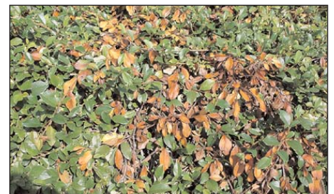
Cotoneaster dammeri mit massivem Befall (ab Ende Juli sichtbar)