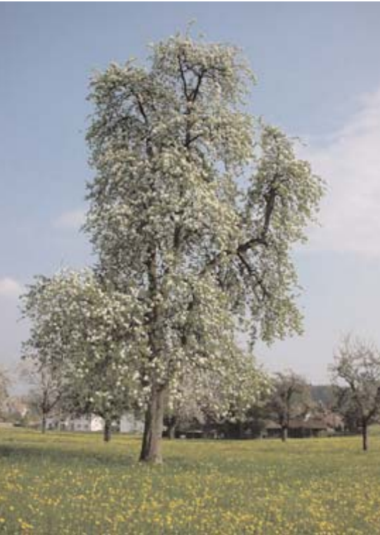
Der Feuerbrand bedroht auch die Kernobst-Hochstämme und damit das Landschaftsbild.

Feuerbrand ist eine gefährliche, meldepflichtige Pflanzenkrankheit, die durch Bakterien verursacht wird. Grosse wirtschaftliche Schäden können in Obstanlagen, Baumschulen und Hochstammobstgärten entstehen. Wild- und Ziergehölze tragen als Infektionsquellen wesentlich zur Ausbreitung der Krankheit bei. Für Cotoneaster , Photinia davidiana (Lorbeermispel) und Photinia nussia (Glanzmispel) besteht seit 1. Mai 2002 eine schweizerische Verordnung, welche Produktion und Inverkehrbringen verbietet. Einzelne Kantone (FR und TG) haben dieses Verbot auf alle Feuerbrand-Wirtspflanzen ausgeweitet.