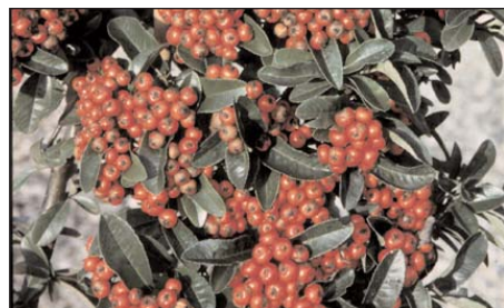
gesunder Feuerdorn ( Pyracantha )