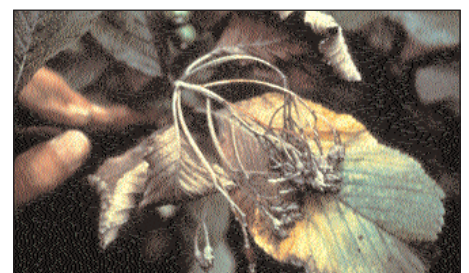
Mehlbeere ( Sorbus aria ) nach Blüteninfektion