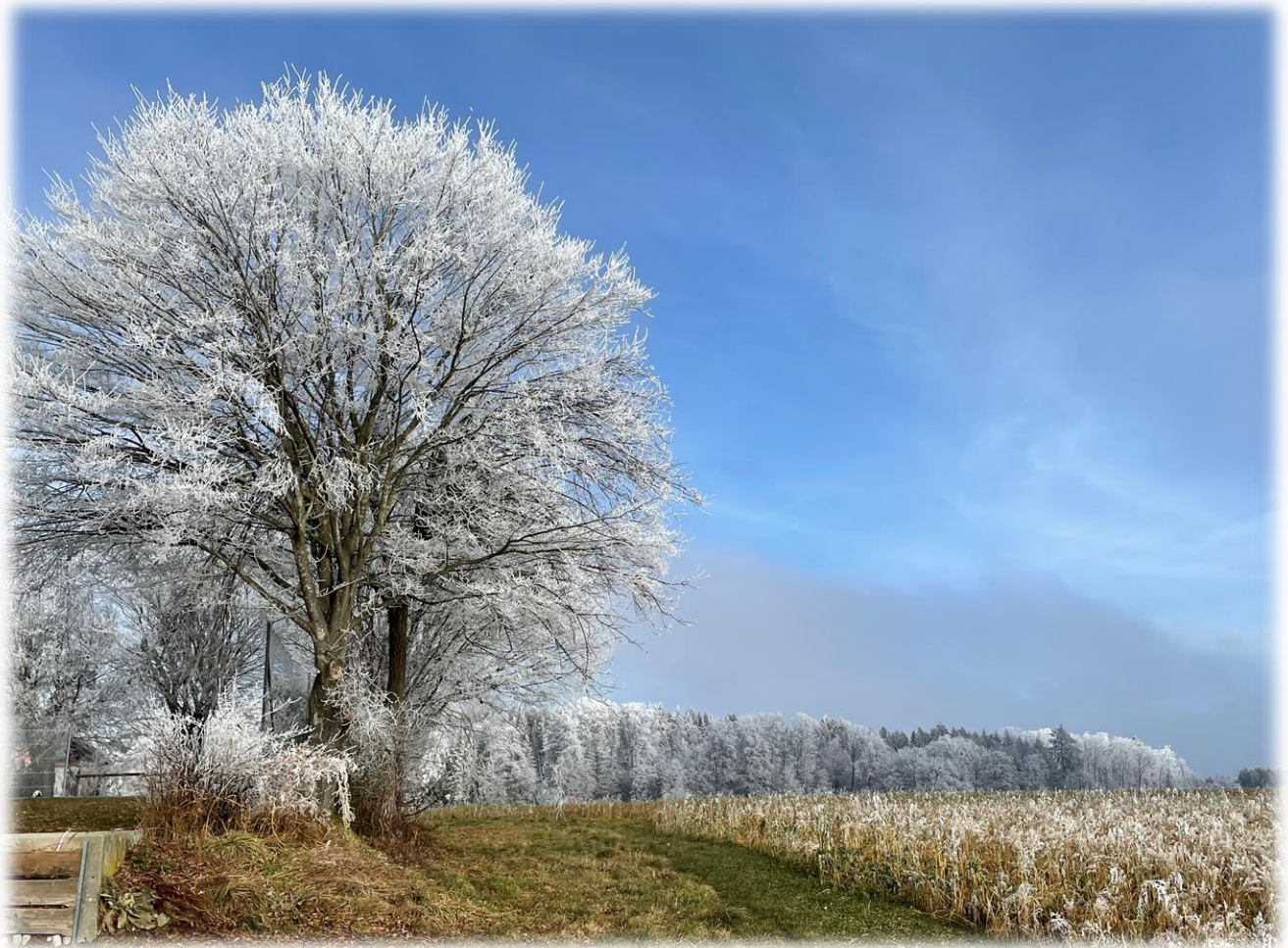
Kunst des Morgennebels in Iffwil

Der Gemeinderat und die Verwaltung wünschen allen Iffwiler und Iffwilerinnen gute Gesundheit und einen sorglosen Start in den Frühling!